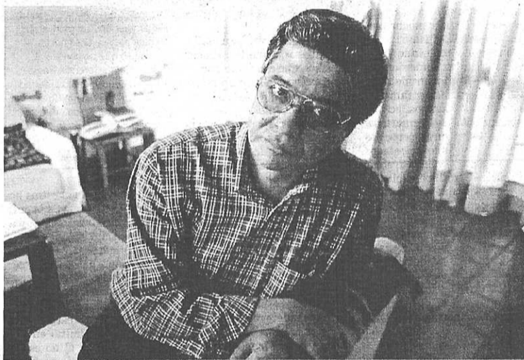
EN EL RECUERDO. El poeta laredino dejó un vacío difícil de llenar. El mundo lo recuerda.