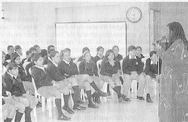
ATENENTOS. Norteamericana en acción.

Las historias que narran estas personas son cuentos tradicionales poco conocidos y por el repertorio internacional que poseen, ayuda a los oyentes a entender las diferencias y similitudes entre diferentes culturas e individuos y provee temas base para discutir sobre valores. Esto permite también, ampliar